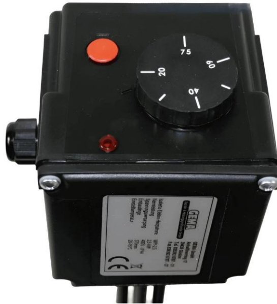
Produktabbildung: Schutzkappe mit Temperaturregler und Kontrollleuchte.

Der GEMA Elektroheizstab WPI ist ein Einschraubheizkörper mit integrierter Isoliertrennung zur direkten Wassererwärmung. Die Ausführung ist besonders für emaillierte Behälter vorgesehen und kombiniert Rohrheizkörper, Fühlerschutzrohr, Temperaturregler, Sicherheitstemperaturbegrenzer und Kontrollleuchte in einem kompakten Schraubkopf.